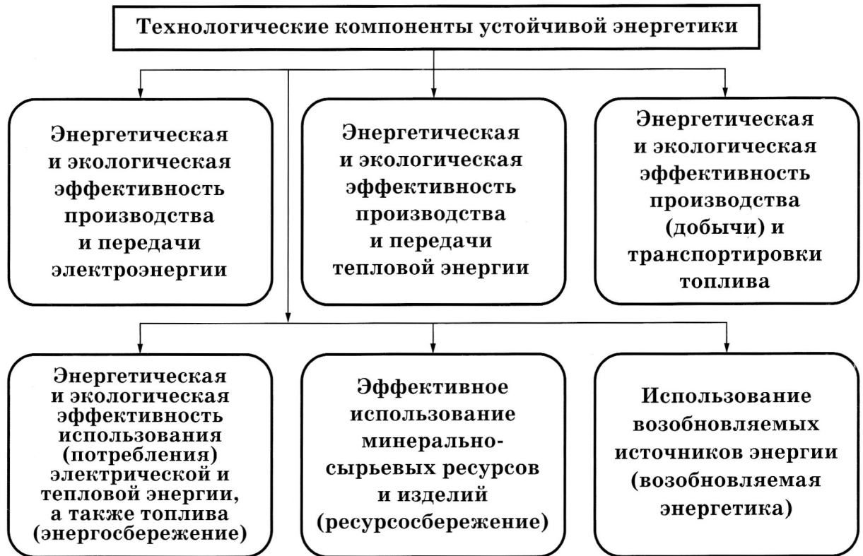
Рис.1. Технологические компоненты «устойчивой энергетики»

новых направлений повышения энергетической эффективности экономики является развитие возобновляемой энергетики или, как ее еще иногда называют, «зеленой энергетики». Это подразумевает более широкое использование возобновляемых источников энергии и применение современных эффективных технологий генерации электрической и тепловой энергии. Использование ВИЭ и их активное внедрение в жизнь с каждым годом приобретает все более серьезные масштабы. К 2020 г. Европейский союз планирует в соответствии со своей энергетической стратегией «20 – 20 – 20» увеличить долю возобновляемых источников энергии в общем топливном балансе до 20%, что по замыслу европейцев даст возможность сократить удельный спрос на традиционные энергоресурсы на 20% [2]. Это позволит странам Евросоюза к 2030 г. увеличить валовой национальный продукт на 79% при снижении энергопотребления на 7%. В перспективе к 2030 г. европейские государства будут получать из возобновляемых источников не менее трети потребляемой энергии. Для мира в целом доля ВИЭ в производстве электроэнергии несколько ниже (табл. 1).